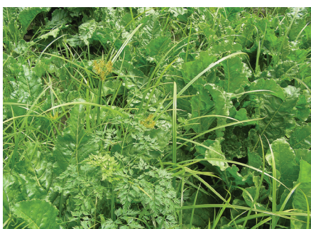
Erdmandelgras in Zuckerrüben