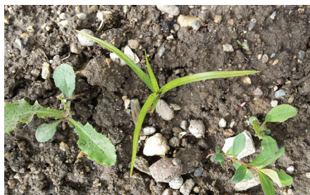
Keimling mit kräftigen Blattspitzen und gelblichen Blättern breitet sich oft als dreizackiger Stern aus.

Das weltweit vorkommende Erdmandelgras breitet sich auf den Feldern im schweizerischen Mittelland meist vegetativ mit rundlichen Wurzelknöllchen rasch aus. Nicht auszuschliessen ist die Vermehrung über Samen. Herbizideinsatz allein reicht nicht aus, denn nur die Kombination von Massnahmen verspricht Bekämpfungserfolg.