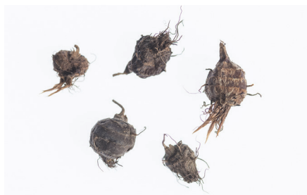
Die rundlichen Knöllchen sind robuste Überwinterungsorgane. Sie werden hauptsächlich durch menschliche Tätigkeiten verschleppt.