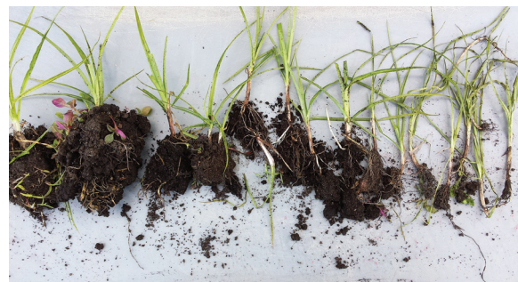
Trennen der Triebe von weissen Rhizomen und Knöllchen (rechts) ist das Ziel der Bodenbearbeitung.

Gut wirksame herbizide Wirkstoffe sind S-metolachlor ( Dual Gold , Sonderbewilligung), eingearbeitet vor der Maissaat sowie Sulfosulfuron ( Monitor mit Netzmittel) im Nachauflauf (NA) im Frühjahr in Winterweizen und Triticale. Der oft erwähnte Wirkstoff Halosulfuron wirkt nicht besser als Dual Gold oder Monitor . Im NA-Mais zeigten Equip Power und Titus + Callisto resp. Calaris sowie Principial + Gardo Gold in Praxisversuchen eine gute Wirkung. Eine Unterblattapplikation von Bentazon in Mais kann das Erdmandelgras zusätzlich schwächen. Glyphosate wirkt nur auf junge Pflanzen befriedigend.