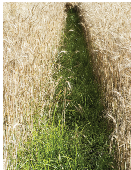
Erdmandelgras kann Licht und Platz in Fahrgassen oder sonstigen Lücken sehr gut ausnützen.

Unsachgemäss eingesetzte Herbizide können zu vermehrter Knöllchenbildung führen. Herbizideinsatz allein reicht somit für die langfristig erfolgreiche Bekämpfung nicht aus.