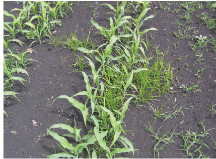
Schadbild in Mais. Knöllchen werden auch von Mäusen verschleppt.