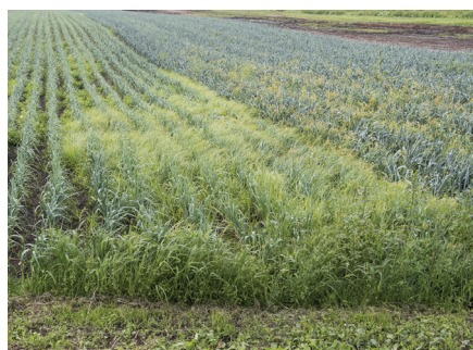
Erdmandelgras in Lauch.