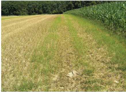
Verschleppung im Feld in Richtung der Bearbeitung.