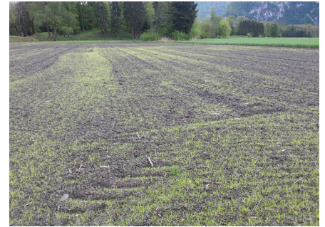
Im Frühjahr die Keimung fördern, um die jungen Pflanzen (2-5-Blatt-Stadium) vor der Knöllchenbildung mechanisch und chemisch zerstören zu können.